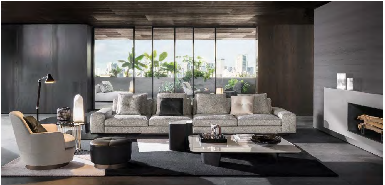
Minotti, Lawrence Sofa, Design Rodolfo Dordoni