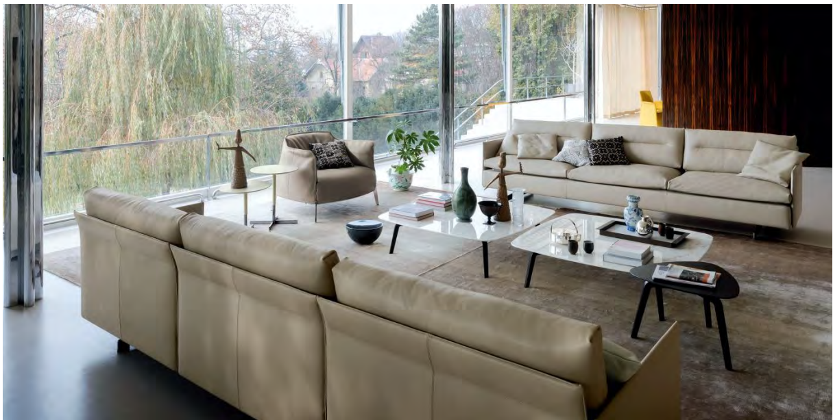
Poltrona Frau, Grantorino Sofa, Design Jean-Marie Massaud