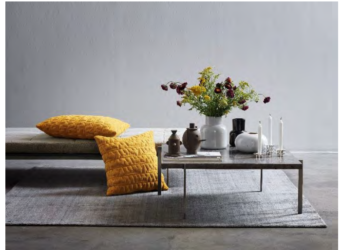
Fritz HanFritz Hansen, Objects Stapelbare Kerzenhalter Louise, Design Grethe Meyer Handgefertigte Töpferware, Design Cecilie Manz GEO Sculptures #1 + #2, Design Jaime Hayon

Frische Schnittblumen sind immer schön fürs Ambiente und schenken dem Raum den persönlichen Touch. Diese sorgen dafür, dass das Wohnzimmer zum Zuhause wird- Man darf ruhig sehen, dass das Wohnzimmer genutzt wird. Manchmal ist weniger mehr - dies gilt auch bei der Auswahl der Zimmerpflanzen, es kann auch mal nur eine grosse sein.