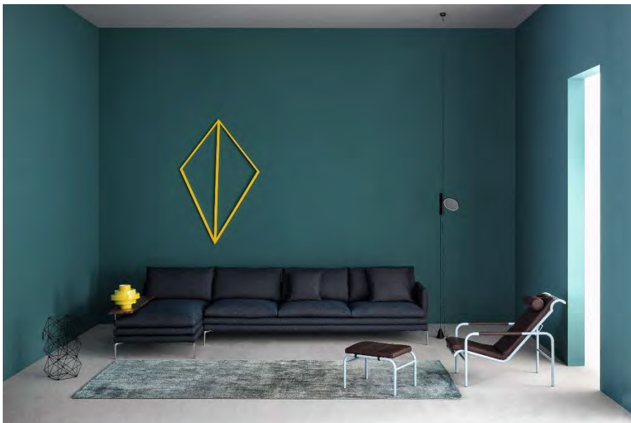
Zanotta, William Sofa, Design Damian Williamson