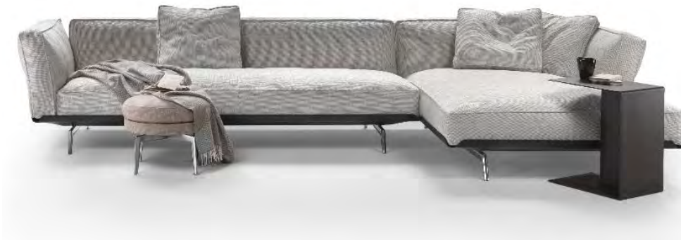
Flexform, Ecksofa Este, Design Antonio Citterio