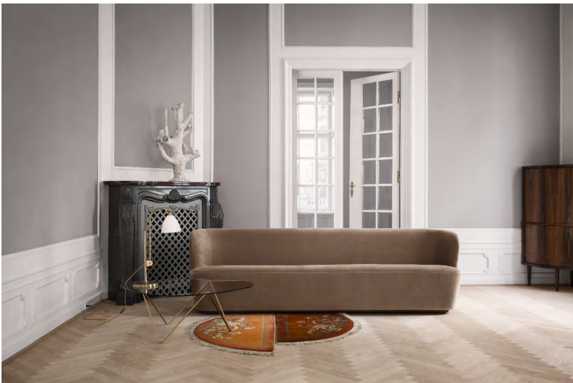
Gubi, Stay Sofa

Falls man keine Bilder an die Wand hängen möchte, kann man auch einfach eine Wand farbig streichen. Achtung, nicht zu dominante und kitschige Farben auswählen, zum Beispiel einen schlichten Grau- oder Blauton. Dieser lässt sich einfach kombinieren - ein Hauch reicht oft schon.