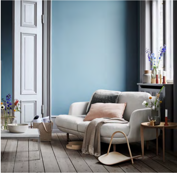
Fritz Hansen, Lune Sofa, Design Jaime Hayon