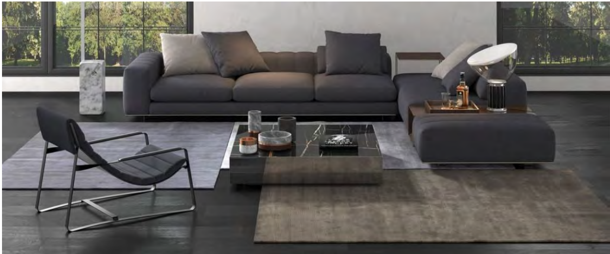
Mischioff, Teppich Tibey