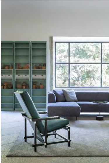
Cassina, Black Red and Blue Chair, Design Gerrit T. Rietveld