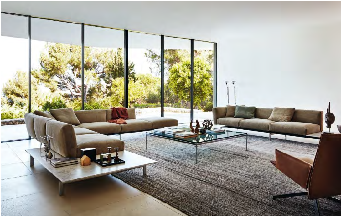
Knoll International, Sofa System, Avio, Design Piero Lissoni

Aber: Es sollten klare Prioritäten gesetzt werden!