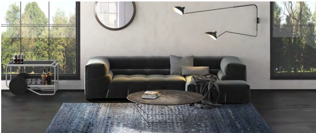
Mischioff, Teppich Circlism