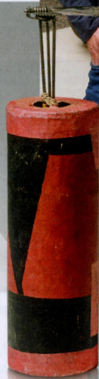
Totem: «Die Dada-Mühle», (1920) von Hannah Höch.