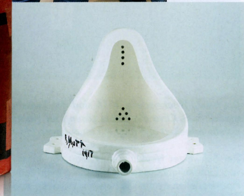
Objekt oder Kunst?: «Fountain» (1917/1964) von Marcel Duchamp.